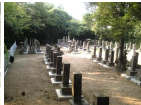
墓石の並びを整頓