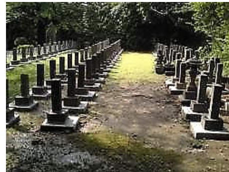
25. 5. 21 撮影【概ね修復完了：墓石の傾きを直し、列を整頓】