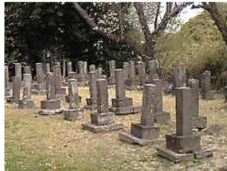
25. 3. 26 中段墓地を背にして撮影