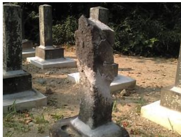
折れた墓石を接着剤等で修復